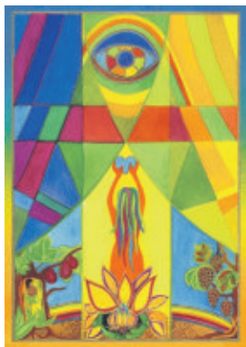
Siehe, du bist schön