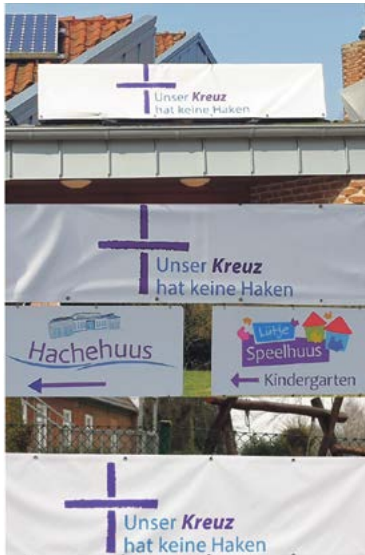
Zeichen setzen gegen Rechtsextremismus: unsere neuen Banner in Syke, Barrien, Heiligenfelde

Wir wollen einander respektieren, unabhängig von Bildung oder Herkunft. Jeder Mensch ist ein Besonderer und sollte so, wie er ist, geachtet werden. Lasst uns offen aufeinander zugehen und miteinander leben.