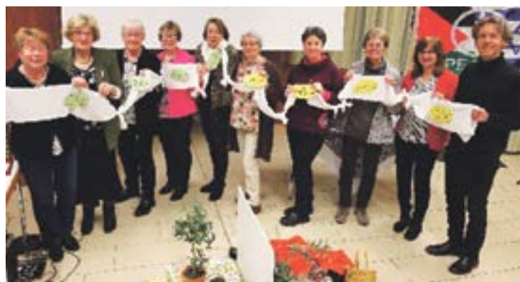
Das Weltgebetstags-Team: „Zusammenhalten ... durch das Band des Friedens“

ihre schwierigen Lebensbedingungen. Wohlgemerkt: Alle Text- und Foto-Dokumente sind schon vor zwei Jahren entstanden, also lange vor dem grausamen Terrorangriff der Hamas auf Israelis am 7. Oktober 2023. Unser ökumenisches Vorbereitungsteam stand vor der schwierigen Aufgabe, wie mit dem Material und den vorgeschlagenen Änderungen umgegangen werden sollte. Wir haben uns entschlossen, die Friedenssehnsucht aller Betroffenen zu betonen, so wie es das Motto des WGT vorgab: „Der Frieden ist das Band, das euch zusammenhält“ (Eph. 4, 3). Die neu ausgewählten Fürbitten, ein Gebet für den Frieden im Heiligen Land, verdeutlichten, dass uns ein starker Zusammenhalt mit Israel und mit den jüdi-