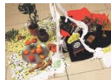
Symbolisch dargestellt ist das geteilte Heilige Land.

Text: Christiane Behrens