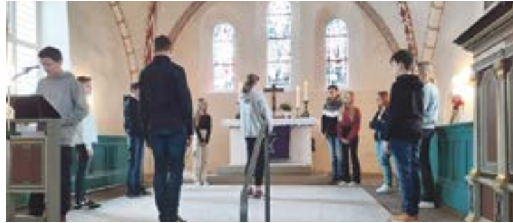
Im Anspiel wurde sichtbar, wie dunkle Gedanken uns einengen können. Und wie wichtig es ist, dem etwas entgegenzusetzen.

Einen Monat vor ihrer Konfirmation haben die 14 Jugendlichen in beeindruckender Weise gezeigt, wie sie die Konfi-Zeit für sich genutzt haben. Im Vorstellungsgottesdienst sind in den selbstverfassten Moderationstexten und Gebeten, genauso in die Auswahl der Lieder, ihre wertvollen Gedanken zusammengefloßen. Gedanken über unser Miteinander wie auch