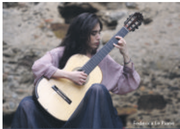
Leidenschaft trifft Virtuosität. Made in Italy.