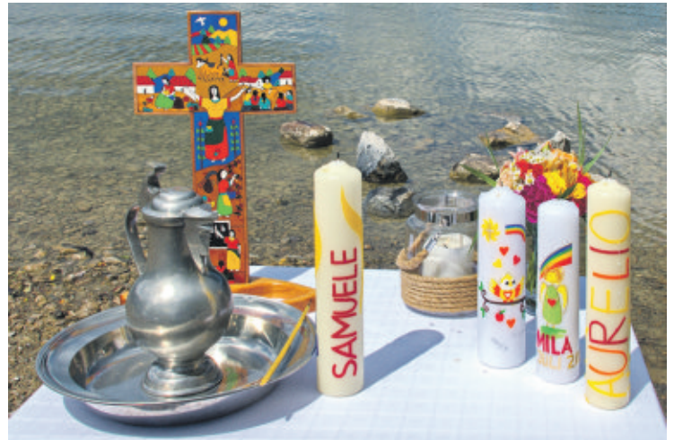
Ab sofort werden in allen drei Gemeindebüros Anmeldungen zur Taufe beim Tauffest angenommen. Die Anzahl der möglichen Taufen ist begrenzt.

sondern die Gemeinschaft mit Gott und unter uns Christinnen und Christen, die mit der Taufe spürbar begründet wird. Mit unserem Outdoor-Tauffest, das von der Musik des Posanenchores Syke-Barrien begleitet werden wird, kommen wir auch den Anfängen unseres Glaubens nahe: Die ersten Christinnen und Christen feierten die Taufe noch nicht in Kirchgebäuden, sondern an fließenden Gewässern, an Flüssen und Seen. Zwar steigen wir mit den Kindern und Erwachsenen, die sich taufen lassen können, nicht direkt in die Hache, aber wir