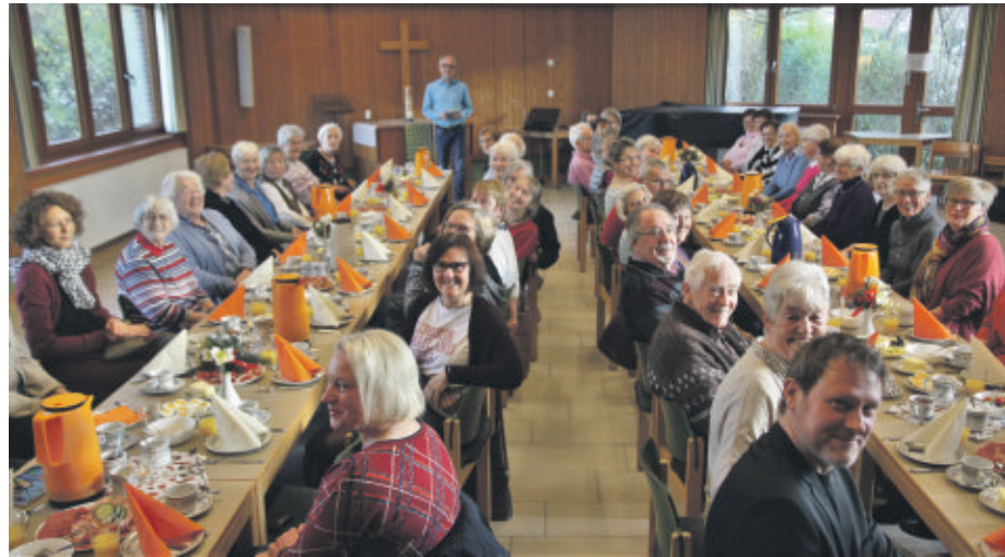
Haben Sie Ihre Dreiklang-Zustellerin erkannt? In alle Syker Haushalte bringen 80 Austräger fünfmal im Jahr das Gemeindemagazin. Am 30. November versammelten sich viele von ihnen zum gemeinsamen Dankeschön-Frühstück im Gemeindesaal. Text: Christiane Behrens