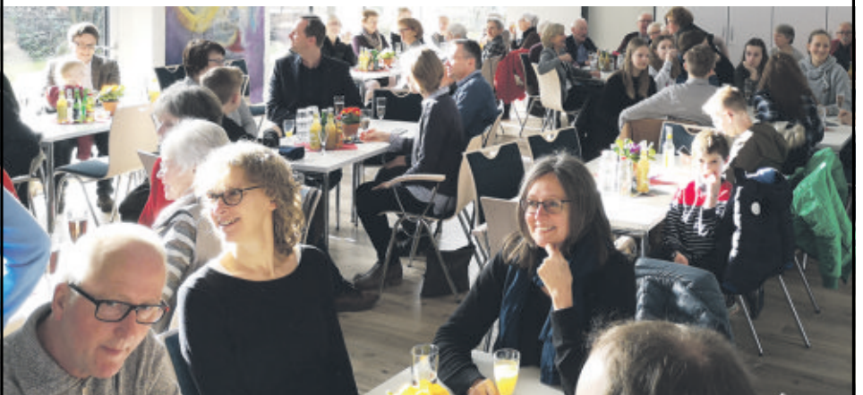
Am 19. Januar feierten wir im Rahmen des Gottesdienstes das Ehrenamtlichenfest. Rund 100 ehrenamtliche Helferinnen und Helfer waren der Einladung gefolgt, sich im Gottesdienst und beim anschließenden Mittagessen im Gemeindehaus für ihre geleistete Arbeit im vergangenen Jahr feiern zu lassen. Vielen Dank für Ihre Mithilfe!