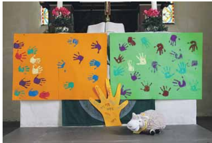
„Gott hält uns alle an der Hand“ – Begrüßungsgottesdienst zum Beginn des neuen Kindergartenjahres

Beginn des Kindergartenjahres in Talita Kumi