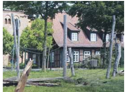
Der Spielplatz musste stillgelegt werden. Nur die Schaukeln und das Seilgerüst konnten stehen bleiben.