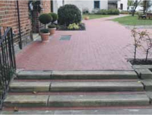
Der Zugang zur Michaelskirche ist nun eben und birgt keine Stolperfalle mehr.

Ein kurzer Bericht über die Baumaßnahmen der vergangenen Zeit