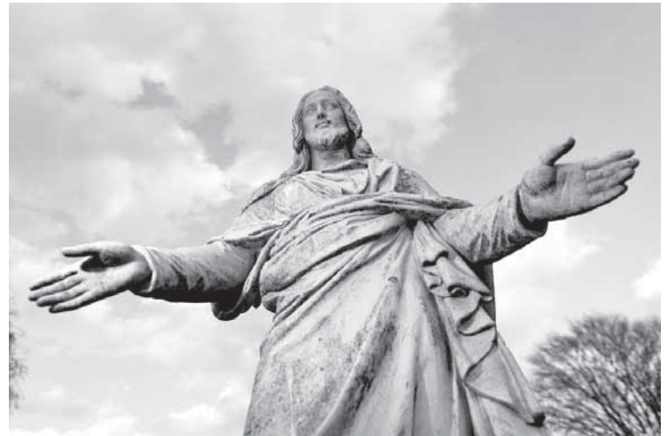
Jens Schulze/Landeskirche Hannover

Gottes Sohn wird ein ohnmächtiger Säugling. Die Frage der Menschen damals: „Ist Gott nun allmächtig?“ wird beantwortet mit einem ohnmächtigen Gott. Gott geht freiwillig in die Machtlosigkeit. Gott bleibt ein armer Wanderprediger, der sich elendig von den Römern auspeitschen und am Kreuz zu Tode foltern lässt. Die Ohnmacht Gottes ist am Kreuz bewiesen. Die Macht liegt bei den Römern. Wie schon 30 Jahre zu-