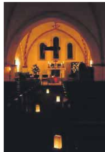
Bei den Abendandachten ist die Michaelskirche von Kerzenlicht erhellt.