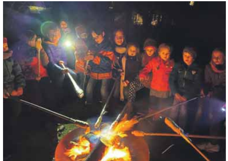
...war genug Zeit zum Spielen und Toben und auch zum Stockbrot machen.

aufführen werden, war dabei im Blick ebenso wie das Spielen, Basteln und gemeinsame Essen. Ein toller Auftakt für die weiteren Proben!