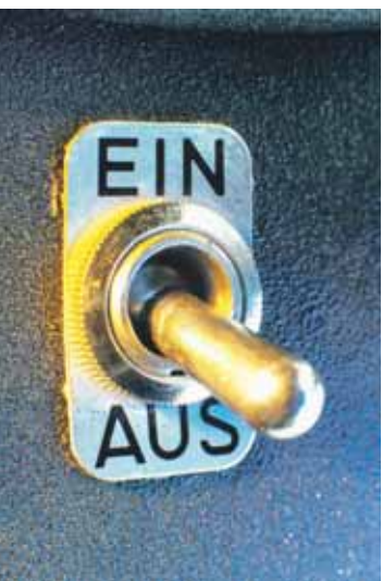
Norman Kläß/Landeskirche Hannover

Doch schon bald erlebt das Volk Israel, dass es ein kleines Volk bleibt. Immer wieder verliert es Kriege. Israel wird verschleppt