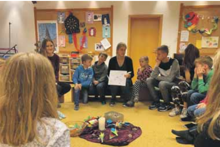
Neben einer Einführung in das Krippenspiel und einer ersten Probe...

Probenbeginn mit einer Übernachtungsaktion