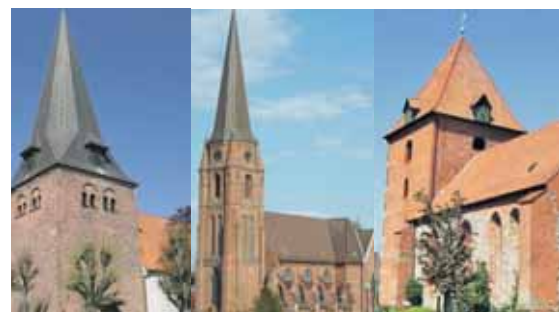
T = Taufgottesdienst A = Abendmahlsfeier

weitere Infos zu den Pfadfindern: www.cp-syke.com