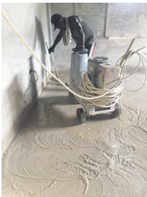
Der Terrazzo-Boden ist vorbereitet, nun erfolgt das Schleifen und das Verlegen der Fliesen.

Der erste Bauabschnitt des neuen Schulbaus in Ghanas Hauptstadt steht vor seinem Abschluss! Darüber freuen wir uns und dan-