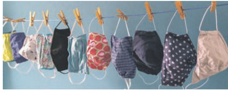
Nase-Mund-Masken werden uns weiterhin begleiten – auch als Zeichen der Nächsten- und Selbstliebe.

Eine Herausforderung stellt der Bereich der Seniorenarbeit dar, da der Platz im Saal des Gemeindehauses nicht ausreicht, um die nötigen Abstandsregeln einzu-