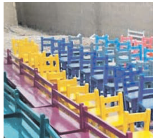
Diese fröhlichen Kinderstühle konnten durch Ihre Spenden gefertigt werden und auch die Türen sind eingebaut.

Am Sonntag, 8. November , laden wir um 9:30 Uhr zu einem Themengottesdienst zu „Shepherds Heart“ ein mit hoffentlich weiteren guten Nachrichten!