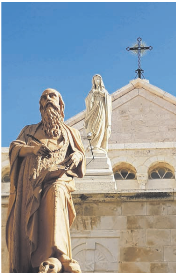
Diese Statue des Hieronymus steht vor der Statue der heiligen Katharina im Klostergarten der Geburtskirche in Bethlehem.

Für ihn war es auch zentral, dass beide Männer und Frauen den Glauben leben und verstehen, so wurde er zu einem anerkannten Seelsorger für Frauen, die auch führende Positionen in